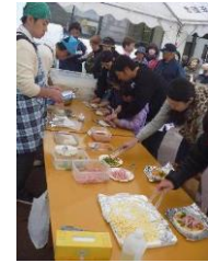
農業選択生徒「石窯ピザ手作りづくり体験」