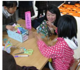
家庭選択生徒「プチカフェ」