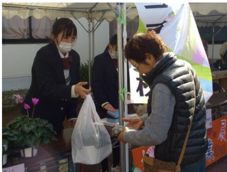
情報ビジネス系列「フェアトレード商品販売」