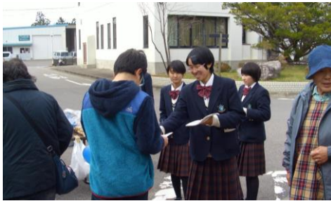
人文・自然系列「総合案内、マスコミ対応」