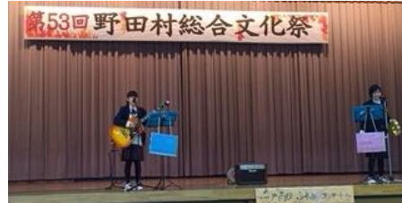
音楽選択生徒「ミニコンサート」