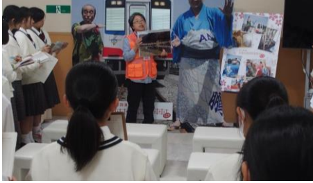
田野畑村の方から発災時の状況について学ぶ