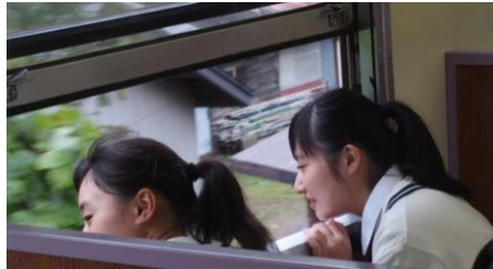
三陸鉄道に乗車し、被災地の方々の生活を知る