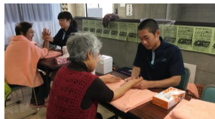
介護・福祉系列「足浴マッサージ体験」