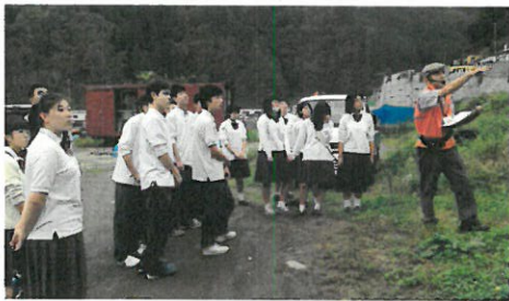
田野畑村の方から発災時の状況について学ぶ