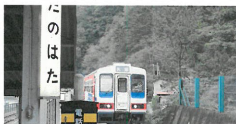
三陸鉄道に乗りし、被災地の方々の生活を知る