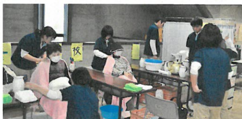
介護・福祉系列「足浴マッサージ体験」