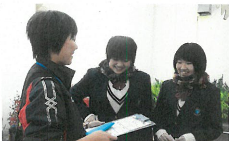
人文・自然系列「総合案内、マスコミ対応」