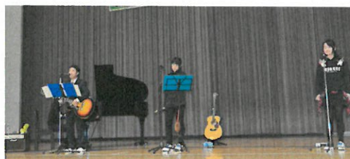
音楽選択生徒「ミニコンサート」