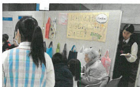
家庭選択生徒「プチカフェ」