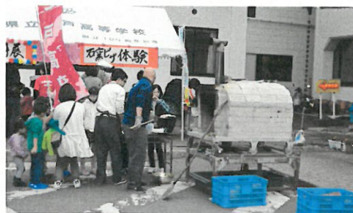
農業選択生徒「石窯ピザ手作りづくり体験」