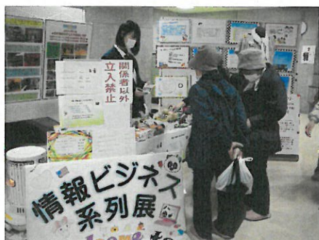
情報ビジネス系列「フェアトレード商品販売」