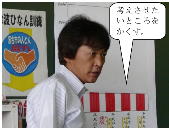
平成 21～26 年の津波避難訓練参加人数のグラフ