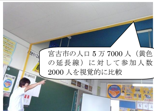
震災前の参加人数 2000 人は多いのか、少ないのか。